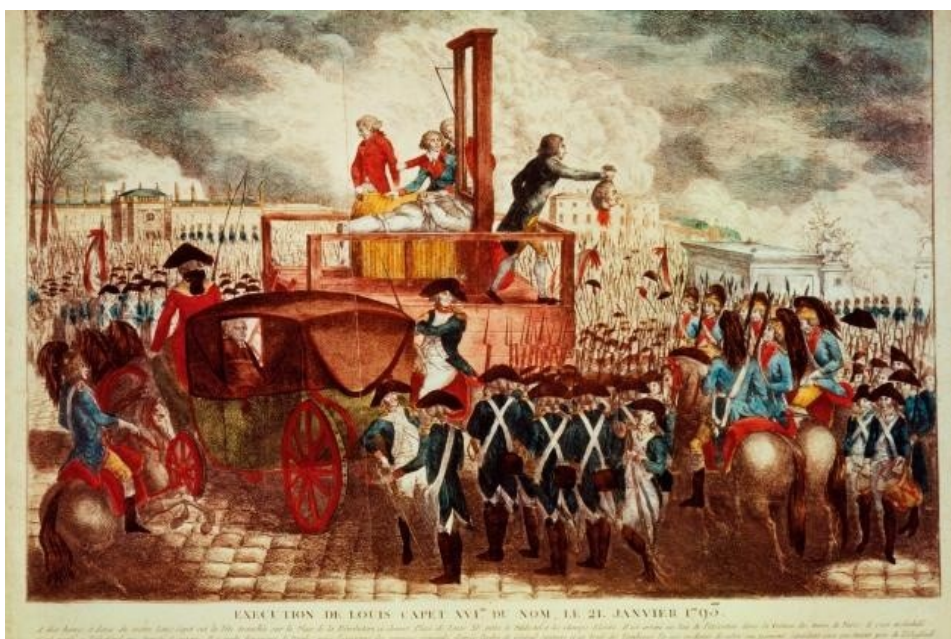
Den franske revolution 1788-1794

Kun gejstligheden havde en landsdækkende organisering, mens adelen havde retsvæsenet, som bolværk mod ændrin-