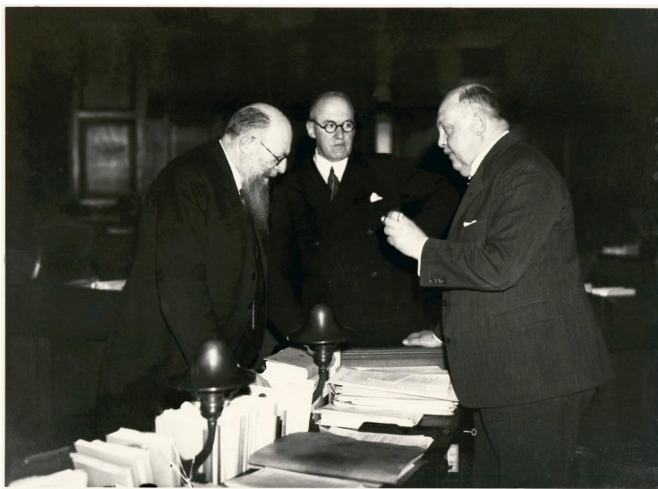
Statsminister Thorvald Stauning (tv.), socialminister K.K. Steincke (i midten) og Venstres forhandlingsleder Oluf Krag under forhandlingerne

Her valgte man at sænke kronkursen med 10%, så det blev billigere at købe danske varer og dyrere at købe udenlandske, det øgede eksporten. Forliget indebar et et-årigt forbud mod lockouter og strejker, samtidigt blev overenskomster forlænges ved lov, dvs. at arbejdere bevarede deres