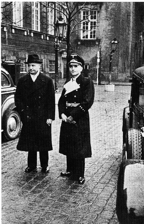
Erik Scavenius (1877-1962) og Werner Best (1903-1989)

ste halvdel af besættelse at undgå jødeforfølgelse og opretholdelsen af en rimelig levestandard. Dog blev det forbudt at være kommunist og mange kommunister blev anholdt, mens andre fortsatte med at lave aktiviteter i det skjulte.