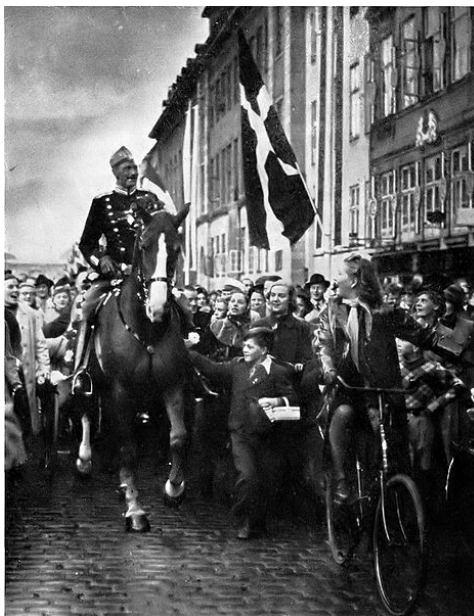
Under besættelsen blev kong Christian X et stærkt symbol på national uafhængighed. Dette billede blev taget på kongens fødselsdag i 1940.

Regeringen blev dog tvunget til at gøre konstante indrømmelser og tilpasninger, men det lykkedes i før-